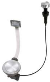
Vidange automatique Space Milano 8407 115