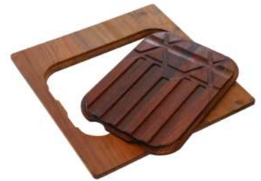
Planche de découpe Twin en bois Iroko 8644 004