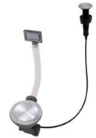
Vidange automatique Space Push 8407 116