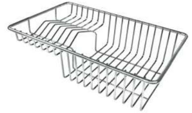
Panier à vaisselle inox 8100 303