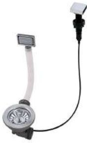
Vidange automatique 8407 113