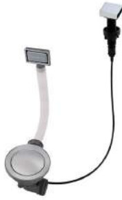
Vidange automatique Space 8407 108