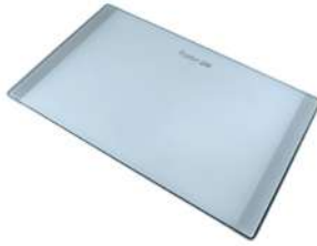
Planche de découpe en verre 8633 300