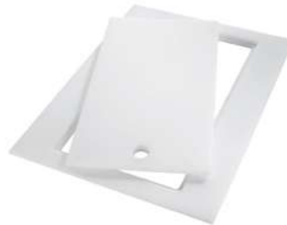
Planche de découpe Twin in HDPE 8644 101