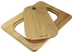
Planche de découpe Twin en bois Iroko 8644 041