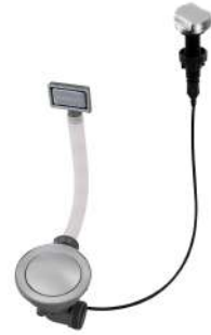
Vidange automatique Space 8407 109