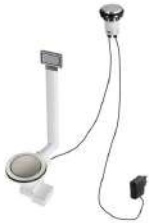
Vidange automatique Space Light 8407 117