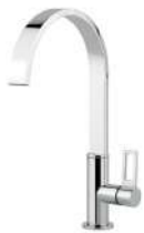
Mitigeur 1/2 Circle 8480 000