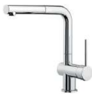
Mitigeur Gamma 8483 001