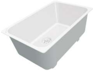
Cuvette blanche 8153 100