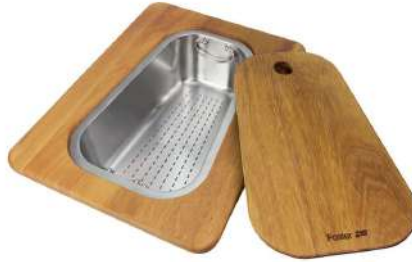
Kit planche de découpe en bois Iroko avec tamis en acier inoxydable 8644 042