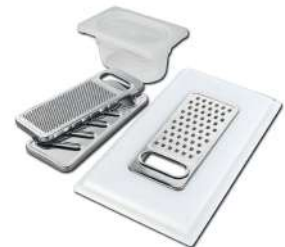
Kit râpes avec anneau de support et cuvette 8159 101