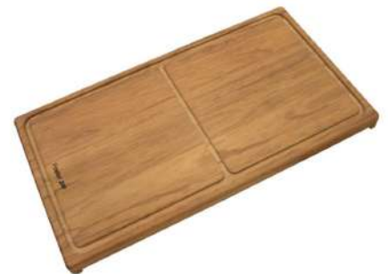
Planche de découpe coulissant Iroko 8643 000