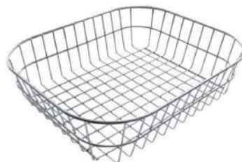
Panier en acier inoxydable 8611 000