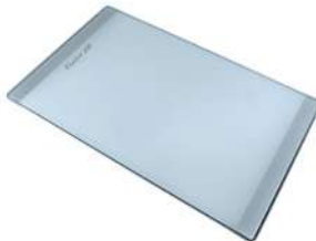
Planche de découpe en verre 8631 300