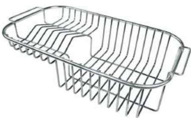
Panier à vaisselle inox 8100 301