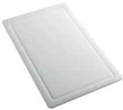
Planche de découpe en HPDE 8657 001