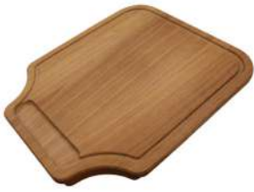
Planche de découpe en bois Iroko 8647 000